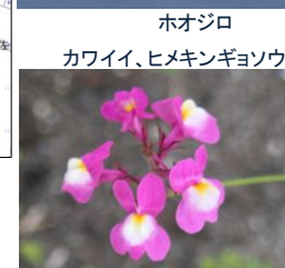
ホオジロ カワイイ、ヒメキンギョソウ

般若院に到着。 お寺の中から、生バンド演奏が聞こえていた。何かイベントがあった模様。境内には屋台の店も出ていて、シダレザクラ目当ての人は多そう。