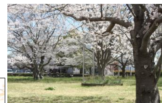
かたらいの郷の桜